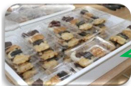
お母さん達が 美味しく味付けして くれたよ！