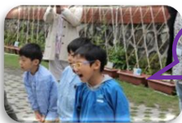
よいしょ〜！！ よいしょ〜！！