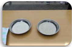
うるち米ともち米 どっちか分かるかな？

も〜ちつきぺったんこ♪と、毎日歌って楽しみにしていたお餅つき会。 お手伝いのお父さん、お母さんと一緒に楽しみました！