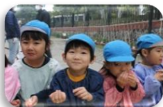
出来上がった おこわを試食！