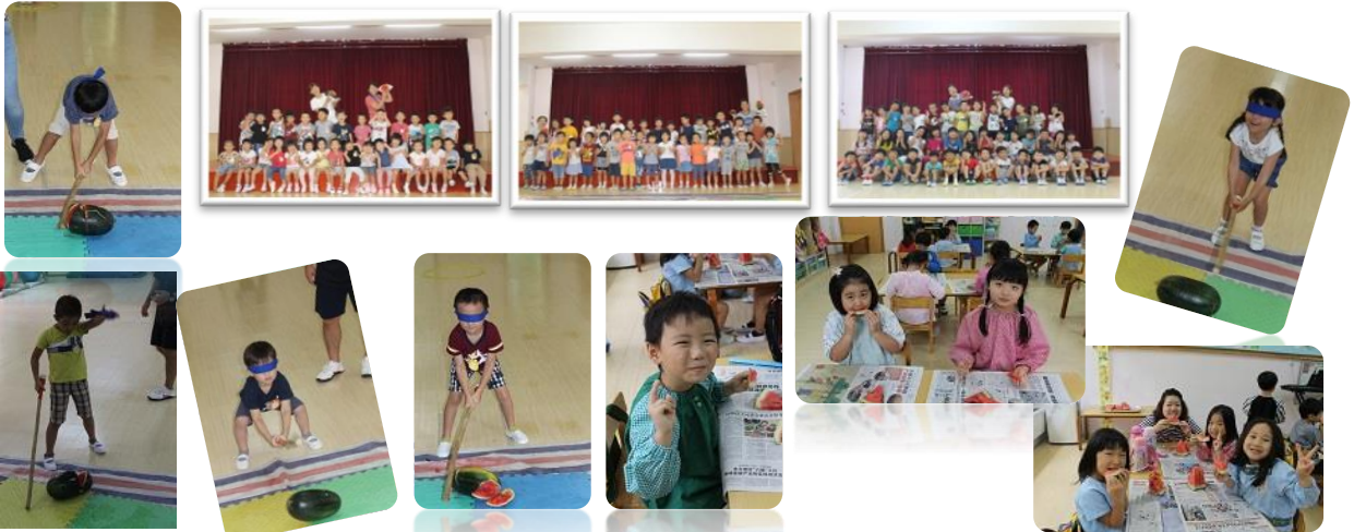
やったー！割れたよ

8月23日(金)にすいか割りを行いました。この日を楽しみにしていた子どもたちは、なんと計10個のすいかを割ることが出来ました!!