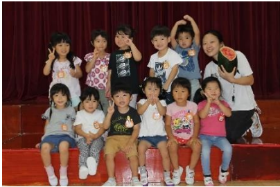
つくし・ひまわり組

8月26日にすいか割りを行いました。全学年で「エイ・エイ・オー」と気合を入れ、目隠しで前が見えない中、お友だちの声を頼りに合計5個のスイカを割ることができました。すいかが、苦手な子も、みんなで食べたすいかは格別だったようです。