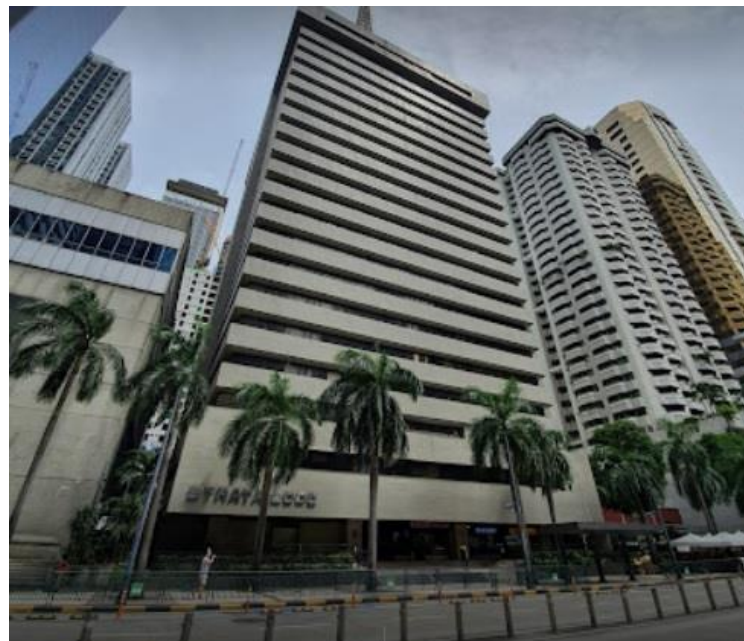
幼稚園が3階に入っているビル 正面入口